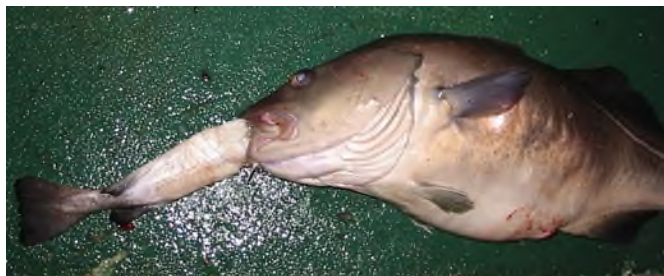
Eldisþorskur í sjókvíum hjá Brim fiskeldi ehf. étir annan þorsk sem var aðeins minni en afræninginn.

Þorskurinn hefur lengi verið þekktur fyrir að éta allt það sem að kjaft kemur, þ.m.t. sína bræður og systur. Á meðal spekinga hér á landi og erlendis hefur oft verið miðað við að bráðin þurfi að vera minna en 50% af lengd afræningja. Það virðist sem svo að þorskurinn þekki ekki sín mörk sem læðir menn hafa sett honum. Hjá Brim fiskeldi ehf. sem nýlega er hætt starfsemi hefur komið í ljós að þorskurinn étur sína bræður og systur sem eru rétt aðeins styttri en afræninginn eins og fram kemur á myndum hér að neðan.