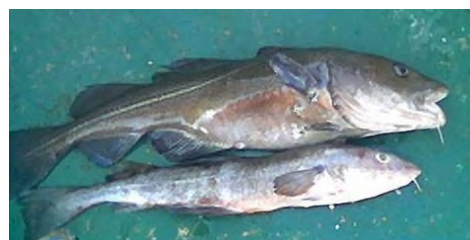
Búið að draga horaðan eldisþorsk upp úr kjafti afræningja úr sjókví hjá Brim fiskeldi ehf..