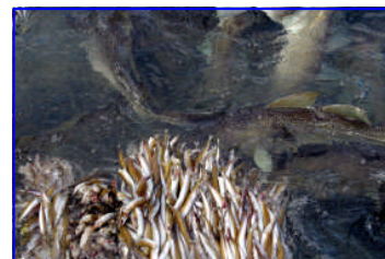
Áframeldisþorskur að éta hálfrosið sandsíli.