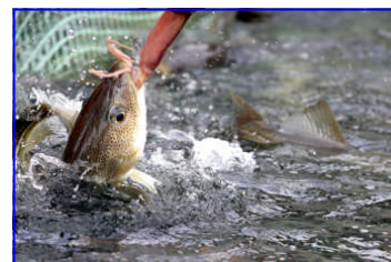
Áframeldisþorskur sem er búinn að aðlagast eldisaðstæðum.