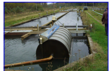
Alskov Dambrug. Tromlusía í forgrunni.