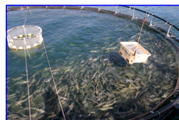
Þorskurinn heldur sig þeim megin sem bátur liggur við eldiskví þegar hann hefur aðlagast eldisaðstæðum.

Slóð: www.hafro.is/Bokasafn/Timarit/fjolr.htm