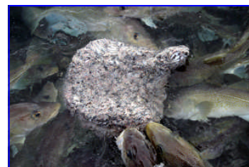
Áframeldisþorskur að éta frosna norræna gulldeplu.