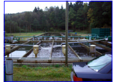
Landeldisstöðin Graunbjerg dambrug í Danmörku.

Á Norður - Ítalíu tilheyra jarðvegstjarnir einnig fortíðinni til og flestar stöðvarnar steiptar. En þar eru menn skemmrá á veg komnir hvað varðar umhverfisþættina og hönnun stöðvanna tekur fyrst og fremst mið af aðgengi að miklu vatni. Auknir þurrkar og hækkandi sumarhiti er farinn að hafa áhrif á framleiðslugetu og hefur magnið helmingast frá því sem mest var.